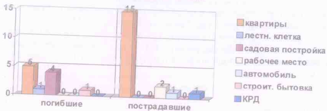
Количество погибших и пострадавших по местам за 12 месяцев 2015 года

* в скобках указано сравнение с аналогичным периодом 2014 года.