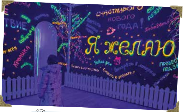
В гостях у «морозного деду»