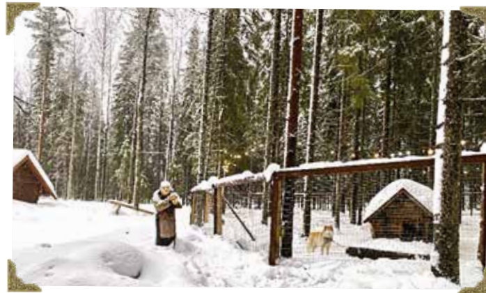
Питомник ездовых собак

Народу было так много, что, когда открылись двери в комнаты, олицетворяющие времена года, нас туда практически занесли вверх по ступеням. Все, что мы смогли услышать во всем этом гаме, так только то, что Талви Укко передвигается на ездовых собаках в санях.